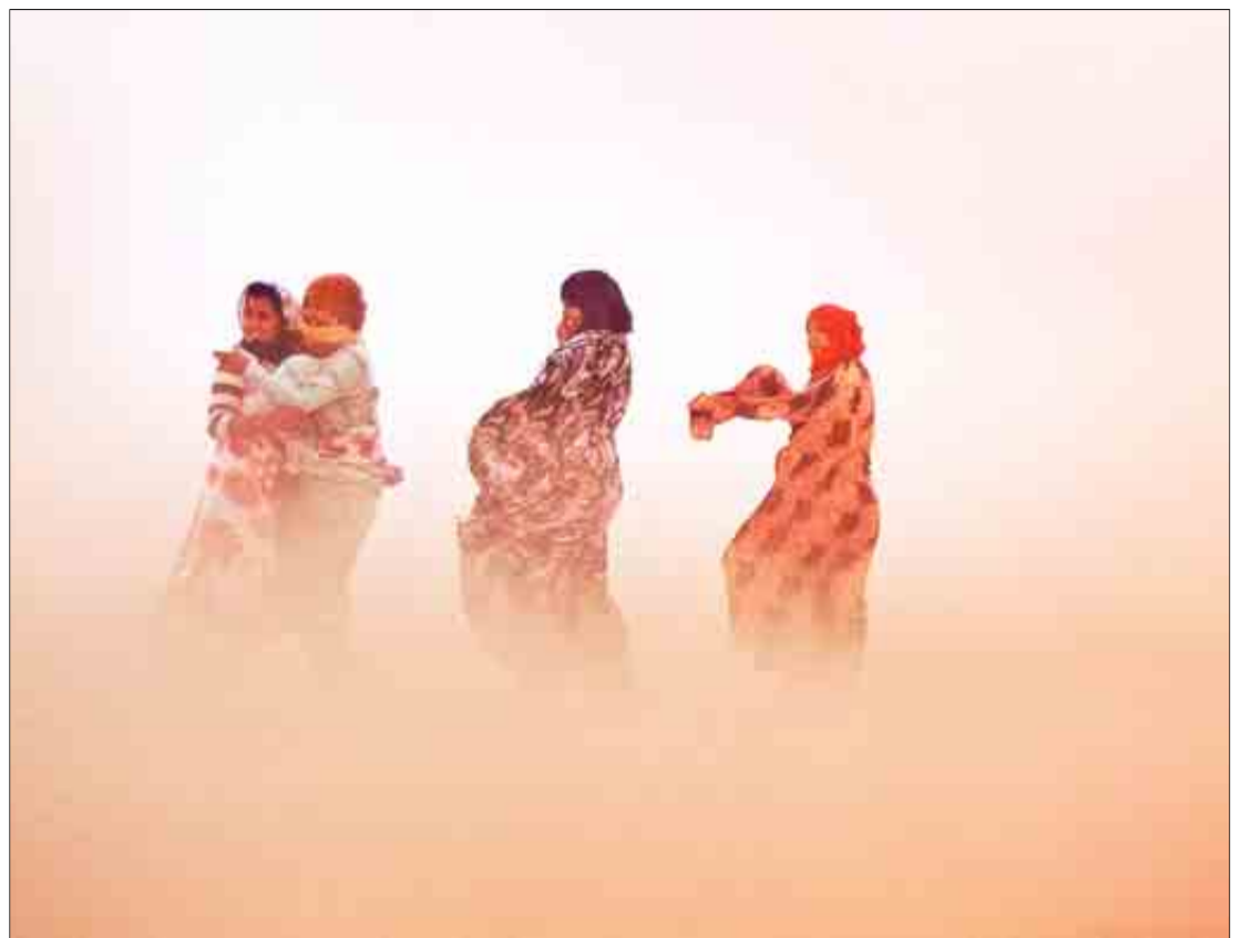
Tormenta de arena en Hammada.

En Hammada están ahora a 55 grados, sin agua y dependiendo de la ayuda internacional para comer. La mortalidad infantil es del 18 por ciento y la esperanza de vida de 45 años. Están aislados por el Muro de la Vergüenza, construido por Marruecos, de 2.720 kilómetros de longitud y rodeado por seis millones de minas letales. «Pero están sobre todo aislados por la indiferencia. No tienen nada que perder, excepto la vida, y son felices en la nada, si no están enfermos», explicaba Cucchi, refiriéndose a los niños saharauíes, en el mensaje inaugural de la exposición. Su reportaje fue algo más