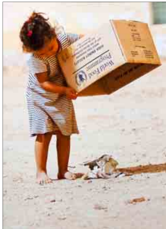
Niña saharauí con una caja de ayuda humanitaria.